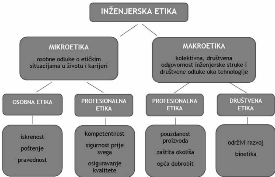
Slika 2. Shematski prikaz razmatranja inženjerske etike (modificirano prema 5 )

Općenito gledano, uloga inženjera u razvoju materijalne osnove društva nedvojbeno je vrlo važna na više načina, ali upravo zbog toga je podložna etičkim promišljanjima i kritici o značaju i utjecaju tehnologije. Inženjerska etika može se razmatrati na više razina i s više različitih gledišta, kao što je to prikazano na shemi na slici 2.